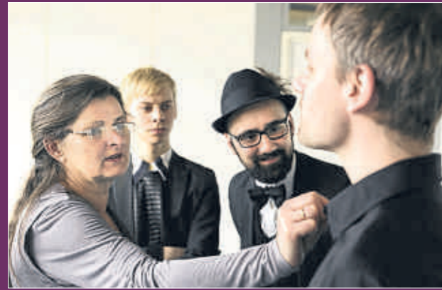
Für den Online-Shop selbst vermessen: Der Kragen passt.